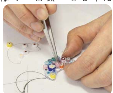
～外国製ガラスで作るアクセサリ～ ガラスを切るのが難しい！ 世界で一つの自分だけのアクセサリ