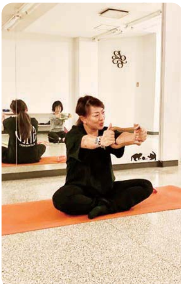
～美人の秘訣は背中から～ たくさん笑って、体も心もスッキリ

毎年恒例となった坂城まちゼミが今年度も開催されました。今回は24講座を開講し、プロの技、役立つ情報、豆知識を参加者に伝授しました。どの講座もお店の方と参加者との距離が近く、気軽に質問できたり、終始和やかな雰囲気の中で学ぶ事ができました。中には毎年まちゼミの開催を楽しみにしている参加者もあり、今後も継続してまちゼミを開催し、町の活性化につなげていきたいと思えます。