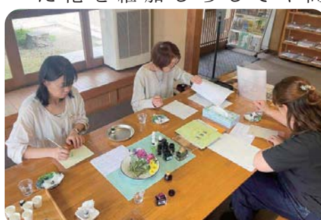
～アロマと楽しむガラスペン～ アロマの香りに包まれ、ガラスペンで文字を書く…癒しのひととき