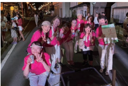
正調の部第3位に選ばれました!