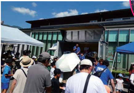
青年部恒例ゲーム大会