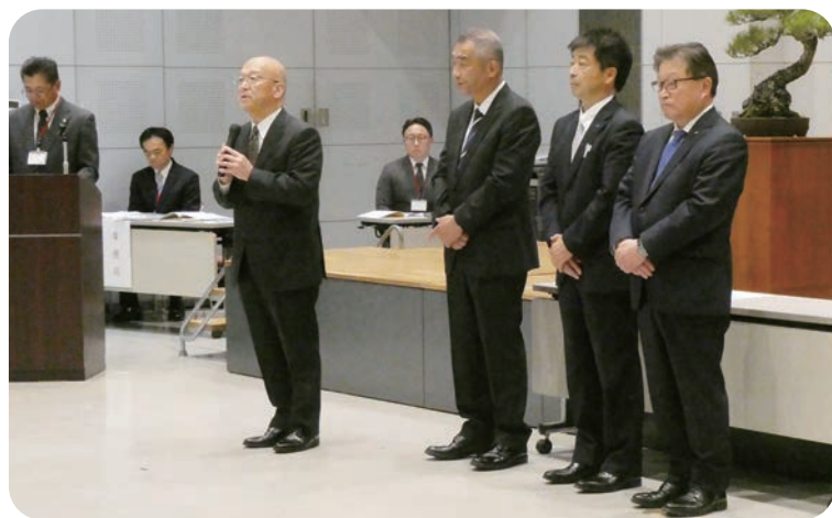
就任のあいさつをする三役（正副会長、相談役）