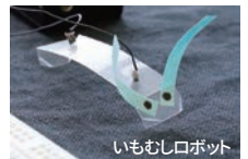
いもむしロボット