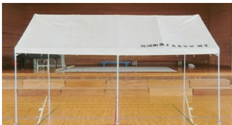
村上小学校へ納品となった新しいテント