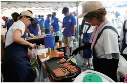
500本のフランクフルトが完売!