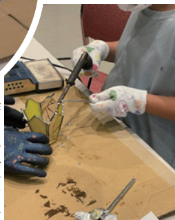
徐々にハンダ付けに慣れてきました。