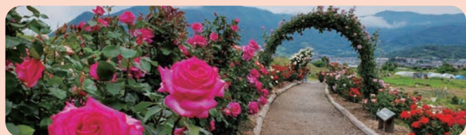
女性部のみなさんのご協力により大変綺麗になり、来場客を楽しませていました。