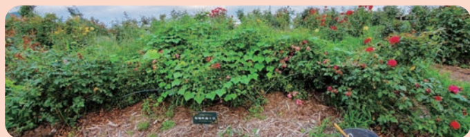
Before 鳥や草が覆いかぶさっていましたが…