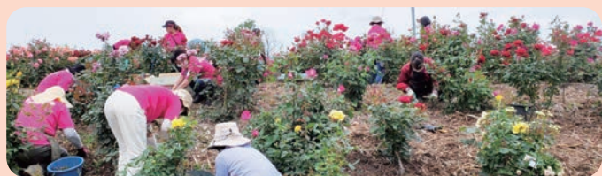
6月 花がら摘み・草取り