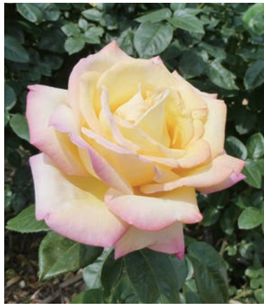
「ピース」第二次世界大戦後、平和を願って名付けられたバラです。

当商工会の区画のバラも女性部の皆さんを中心に定期的にお手入れ頂き、見事なバラを咲かせていました。