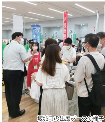
坂城町の出展ブースの様子

6月29日(水)東京・浜松町にて食の魅力発見商談会2022が開催されました。バイヤーとのマッチングの機会や地域活性化の支援を目的とし、全国の地域食品に特化した商談会として2011年より毎年開催され、今年も3年ぶりのリアル商談会の開催となり全国から67の企業が出展し、坂城町からは2つの事業所が参加しました。