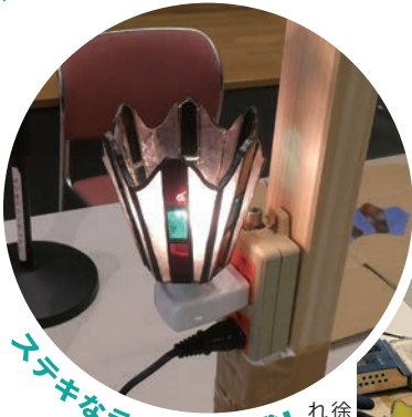
ステキなランプが完成!